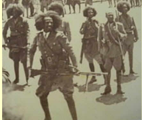
ደጃዝማች ፡ ሀብተ ፡ ሥላሴ ፡ በላይነኝ ፡ እና ፡ ሰራዊታቸው ።

የተሰጠው ፡ በደጃዝማች ፡ ሀብተ ፡ ሥላሴ ፡ በላይነኝ ፡ የሚመራው ፡ ቍጥር ፡ ጦር ፡ ባስደናቂ ፡ ዝግንኝትና ፡ ስልት ፡ የጎንደርን ፡ ምሽግ ፡ ሰብሮ ፡ በመግባት ፡ ኅዳር ፡ 18 ፡ ቀን ፡ 1934 ፡ ዓ.ም. ፡ የዐምስት ፡ ዓመቱን ፡ ጦርነት ፡ መደምደሚያ ፡ ድል ፡ አበሠረ ።